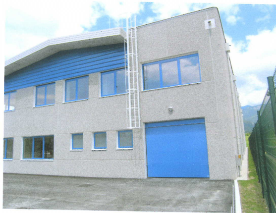
REGIJSKO SKLADIŠČE IZPOSTAVE URSZR NOVA GORICA V AJDOVŠČINI