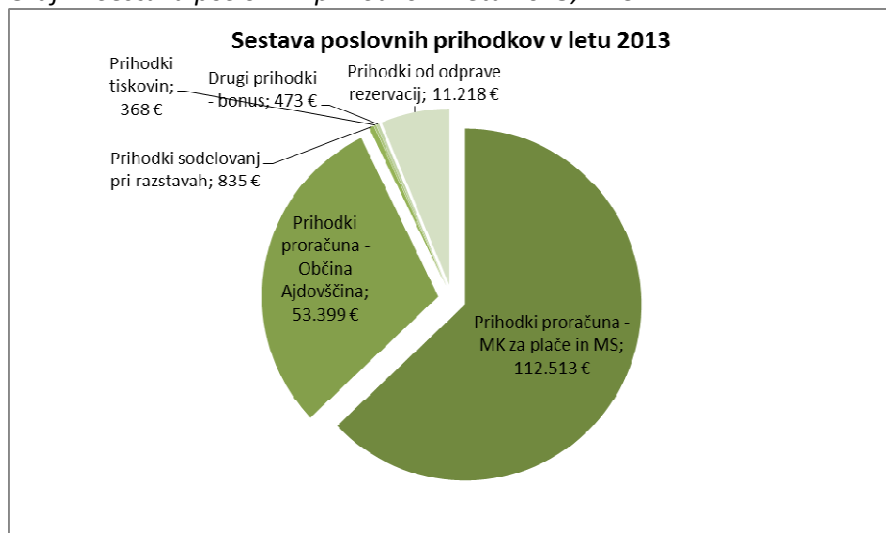
Graf 2: Sestava poslovnih prihodkov v letu 2013, v EUR