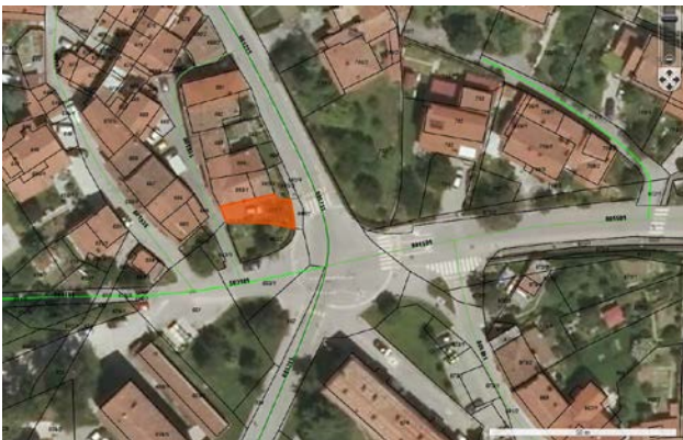
686/3 k.o. Ajdovščina