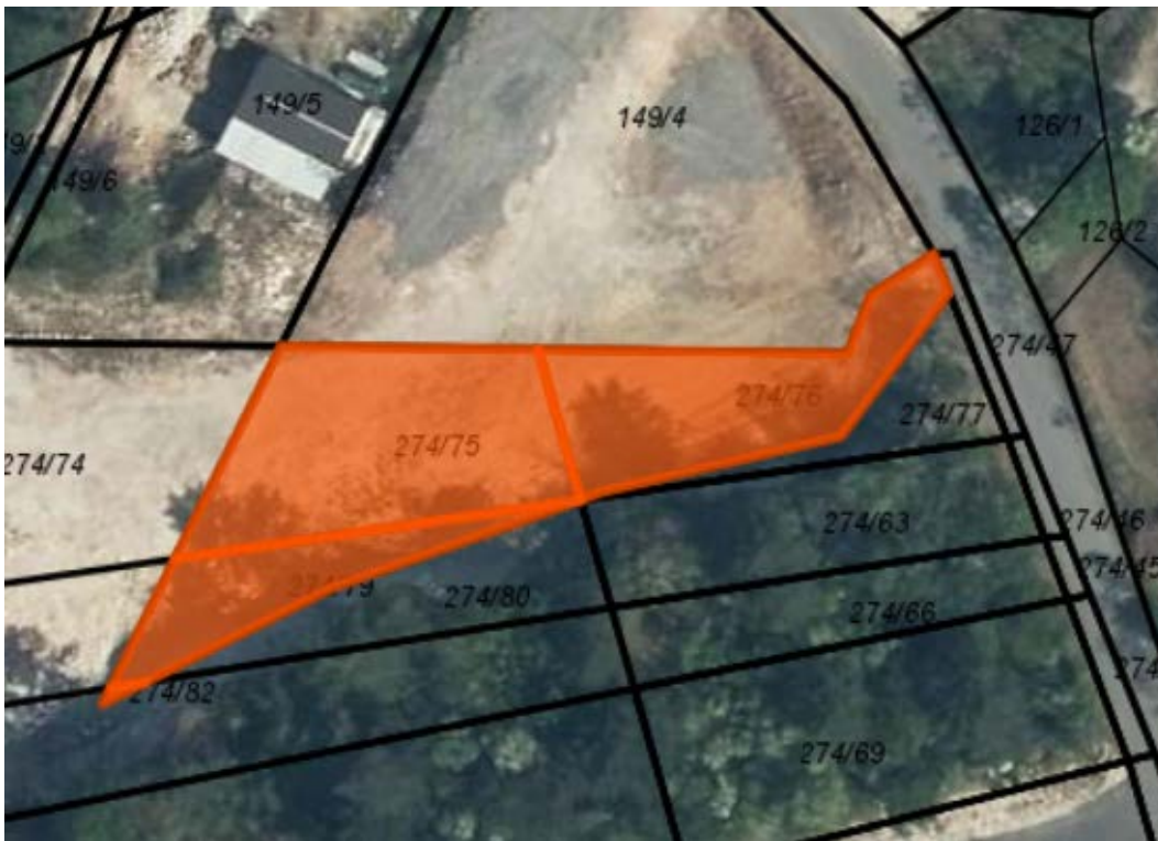
Sklop 3: Parc. št.: 274/66, 274/69, 274/63 in 274/77, vse k.o. 2384 Črniče