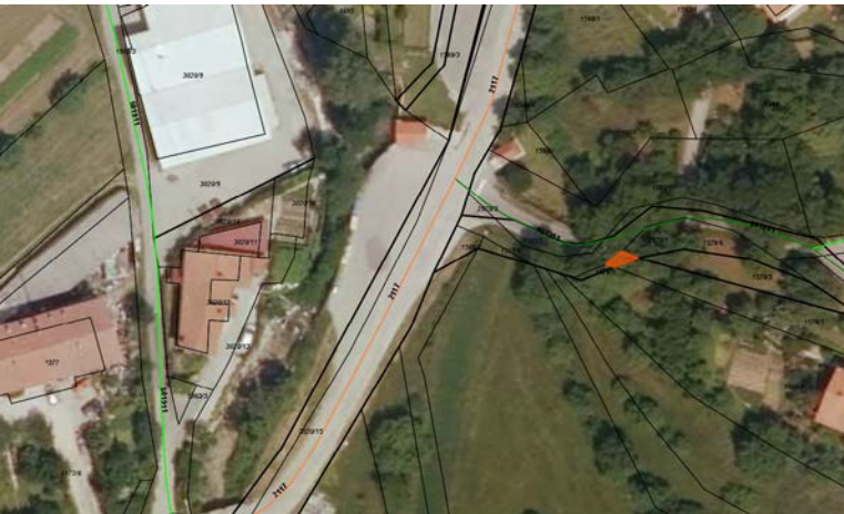
Parc. št. 1528/4 k.o. 2381 Lokavec