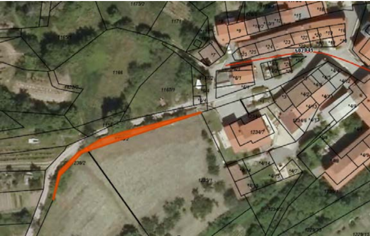
Parc. št 1235/2 in 1238/2, obe k.o. Velike Zablje