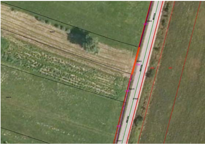
Parc. št. 1639/6 k.o. 2391 Vipavski Križ