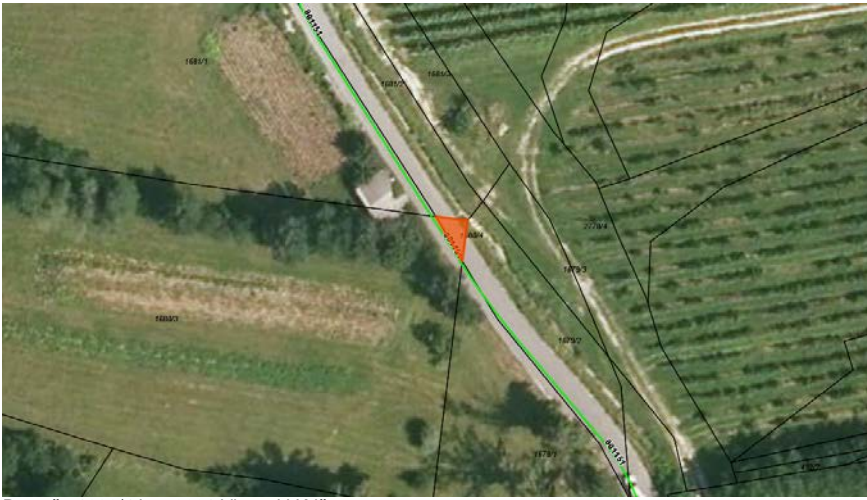
Parc. št. 1680/4 k.o. 2391 Vipavski Križ