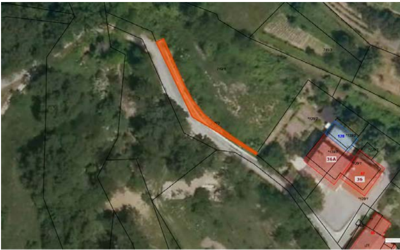
Parc. št. 745/3 k.o. Stomaž