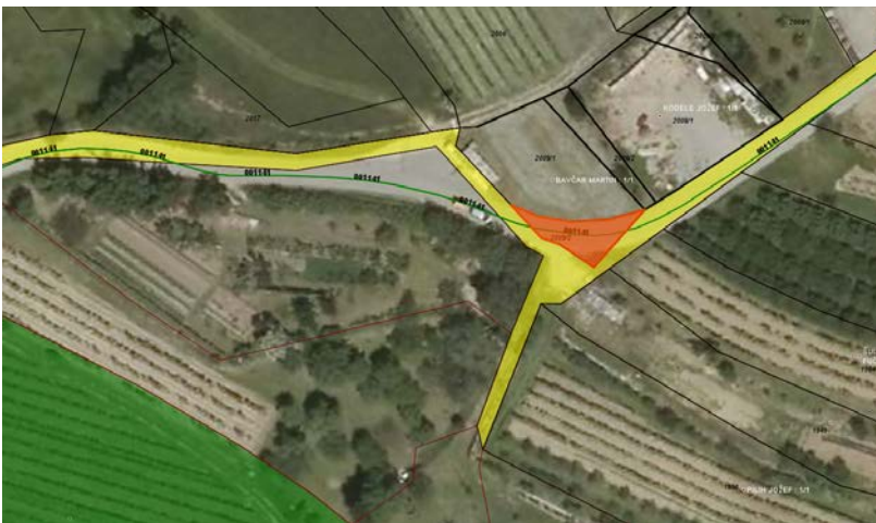
Parc. št. 2009/2 k.o. Budanje