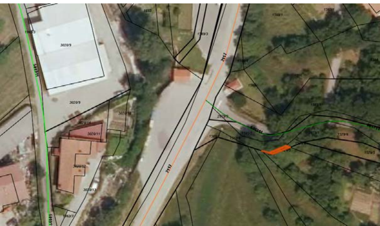
Parc. št. 1526/5 k.o. 2381 Lokavec