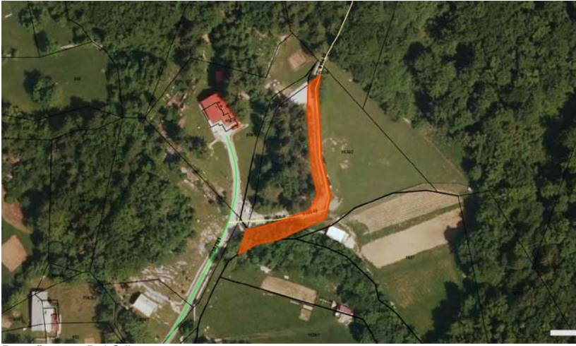
Parc. št. 1636 Dol-Otlica