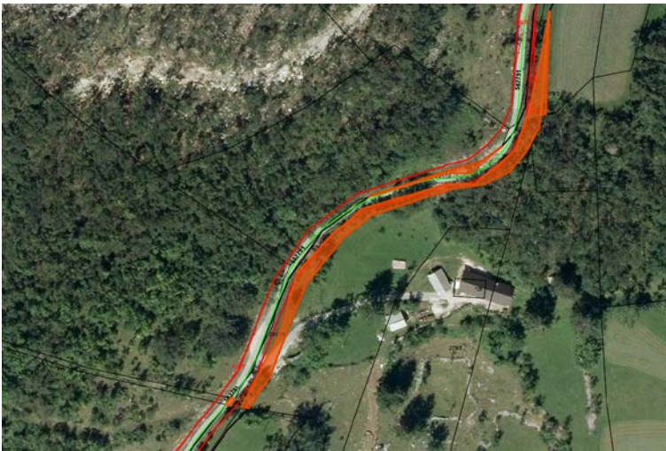
Parc. št. 261/22, 279/4, 279/5 in 261/20, vse k.o. 2371 Kovk