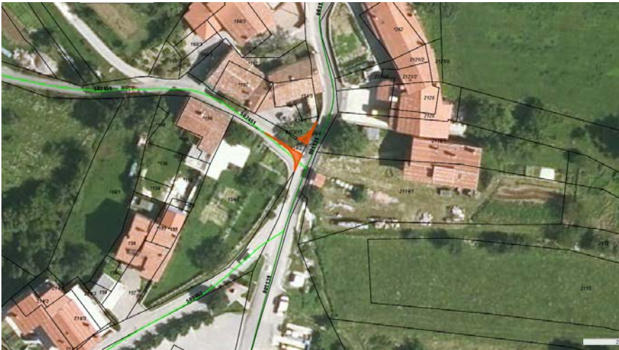
Parc. št. 154/2, 154/4 obe k.o. 2379 Budanje