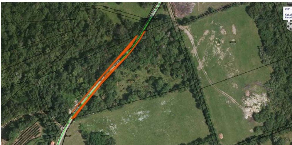
Parc. št. 1220/60, 1220/33, 1421/105, 1421/106, 1421/69, vse k.o. 2399 Planina