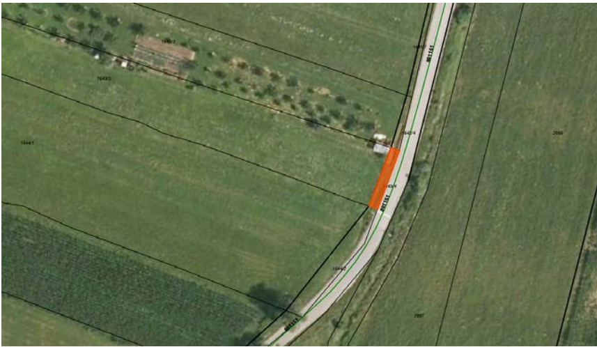
Parc. št. 1643/4 k.o. 2391 Vipavski Križ