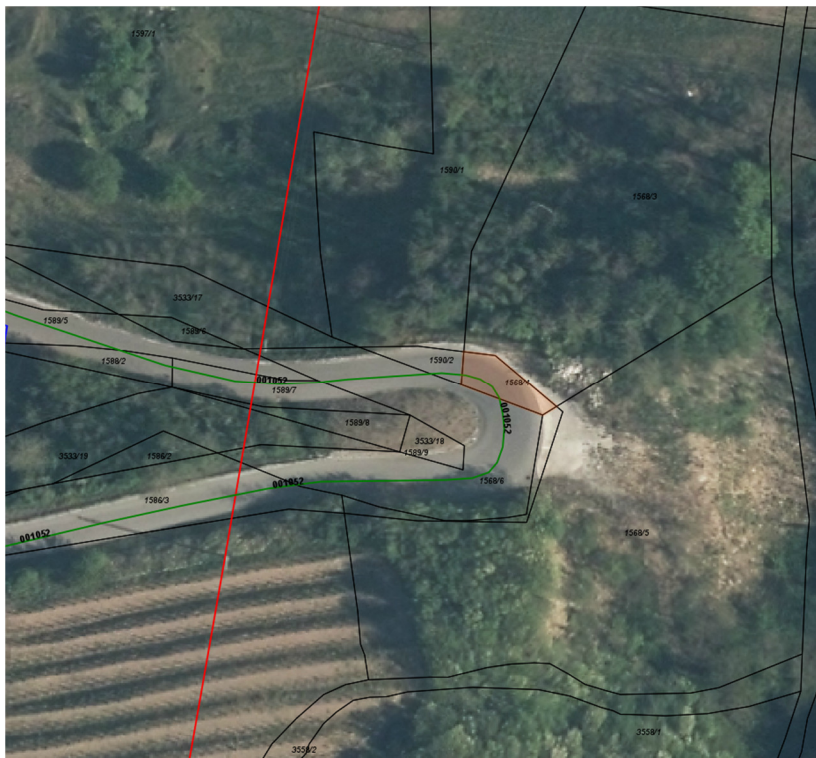
Parc. št. 1568/4 k.o. 2395 Brje