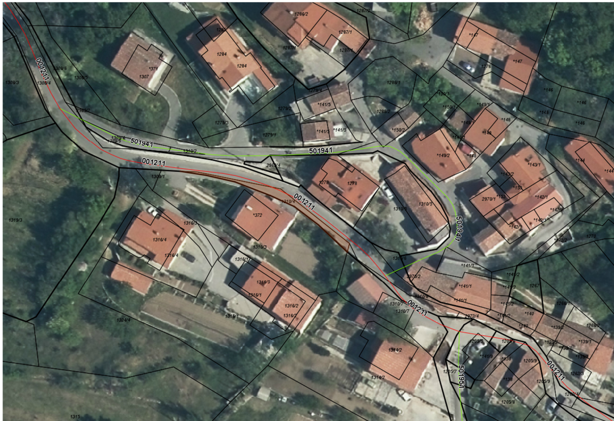
Parc. št. 1310/4 k.o. 2381 Lokavec