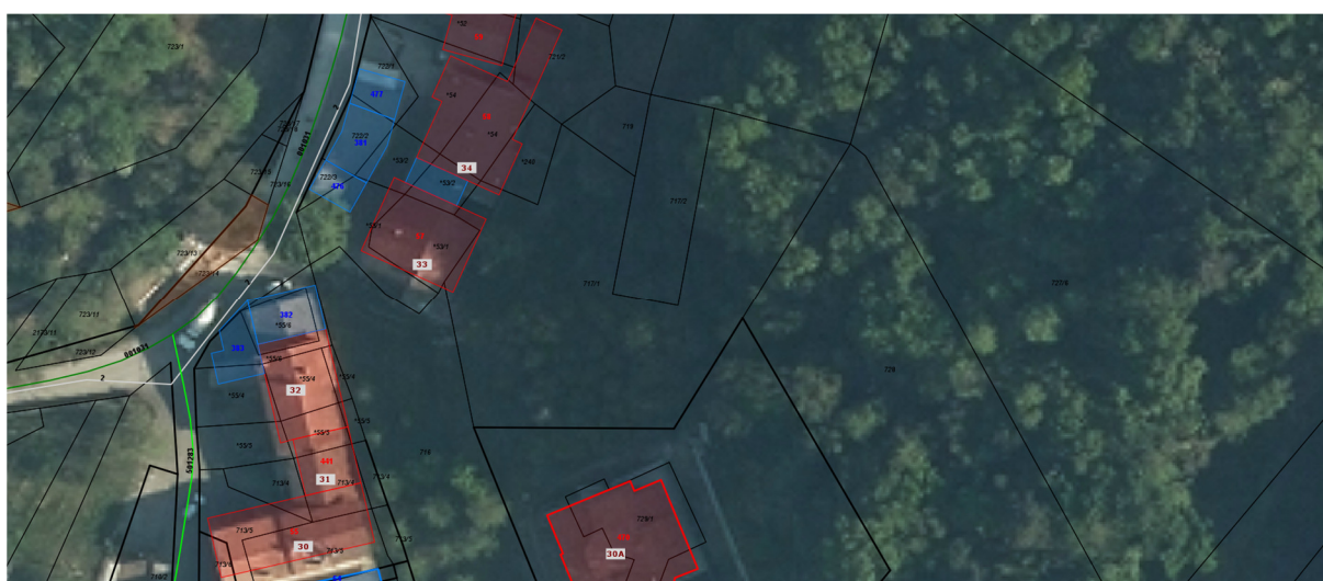
Parc. št. 723/14 k.o. 2383 Vrtovin