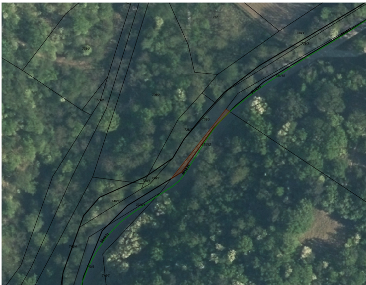
parc. št. 751/12 k.o. 2388 Kamnje