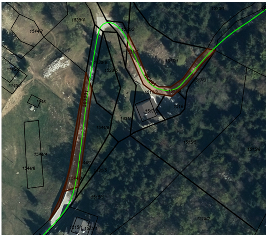
Parc. št. 1544/7, parc. št. 1544/9, parc. št. 1517/4, vse k.o. 2370 Dol-Otlica