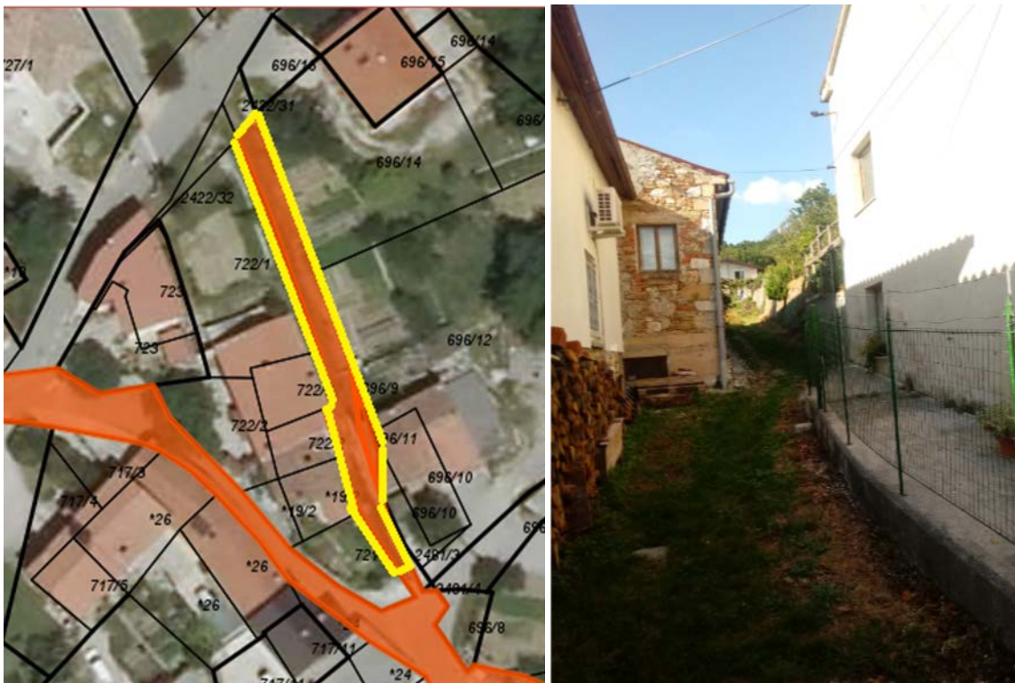
Z rumeno je označen del parc. št. 2481/1 in celotni parc 696/9 in 696/11 k.o. Budanje