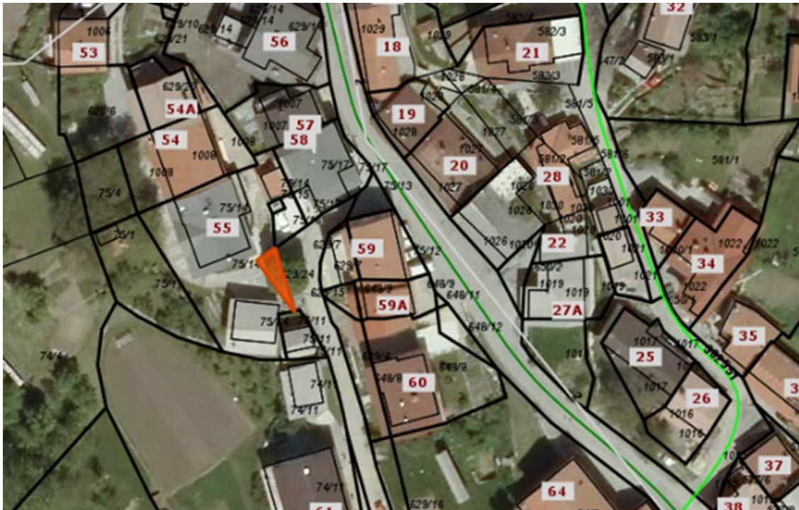
Z oranžno barvo je označena parc. št. 629/24 k. o. 2375 Podkraj