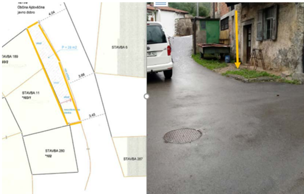
Z rumeno označen del parc. št. 1817/8 k. o. 2394 Velike Žablje