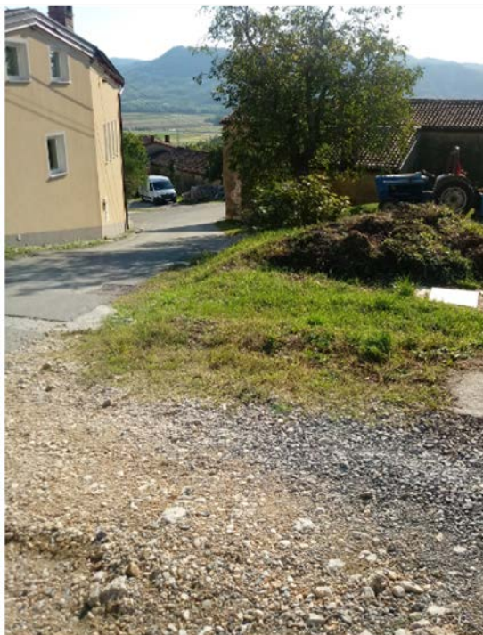
Z rumeno je označen del parc. št. 2482/1 k.o. Budanje