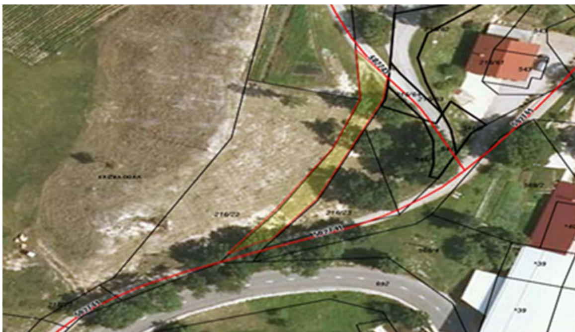
Z rumeno označen del parcele parc.št. 216/71 k.o. Križna Gora