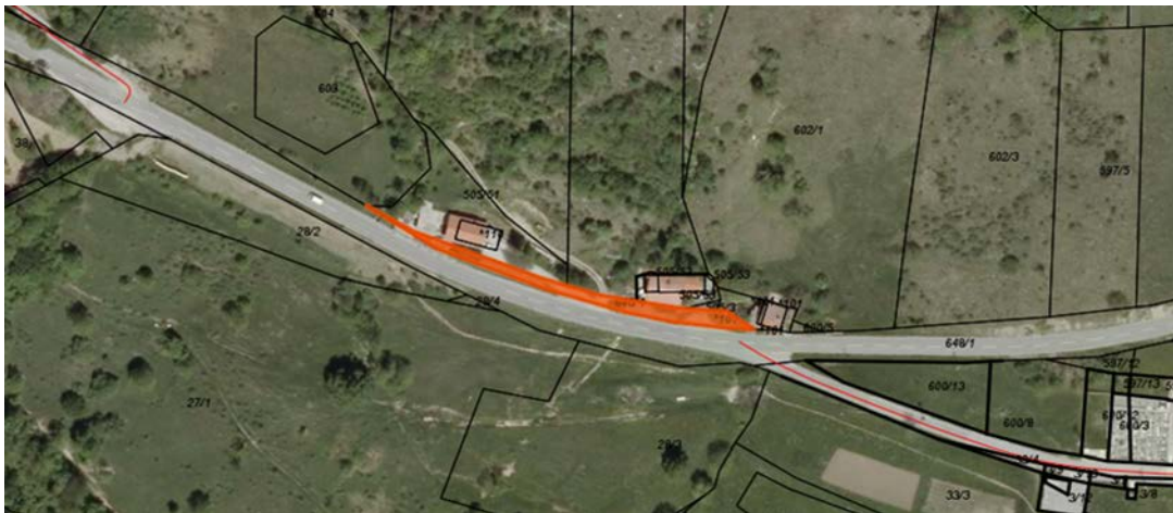
Z oranžno označena parc. št. 648/4 k.o. Podkraj, del državne ceste R3-621/1412 Podkraj-Col