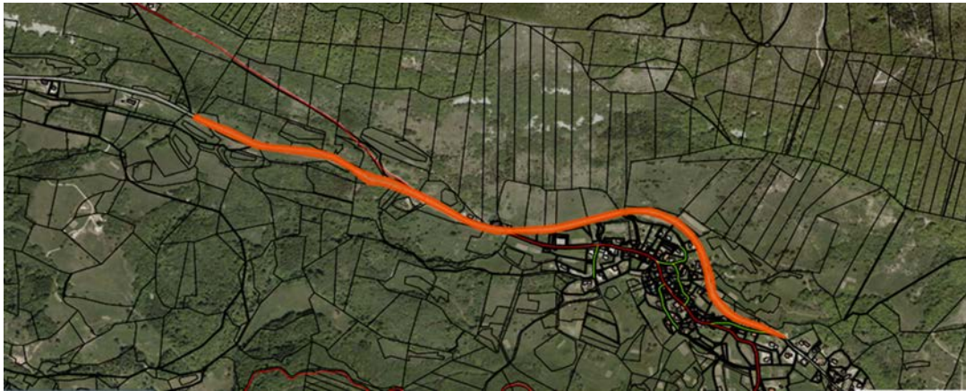
Z oranžno barvo označena parc. št. 648/1 k.o. Podkraj, del državne ceste R3-621/1412 Podkraj-Col