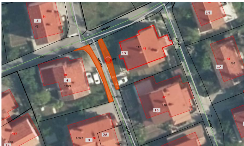
Desno parcela 118/2 (predmet sklepa), levo 119/2 (obe k.o. Ajdovščina)

Glede na to, da površina, predmet sklepa po dejanski rabi ni v splošni rabi, dejansko pa je za splošno rabo – vožnjo in hojo, namenjena površina v neposredni bližini, se v sprejem predlaga priloženi sklep, saj je izpolnjen tudi pogoj, ki ga določa 262. člen ZUreP-3, iz katerega izhaja, da status grajenega javnega dobra preneha in se lahko odvzame, če se uredi zemljišče ali zgradi drug objekt z enakim namenom splošne rabe.